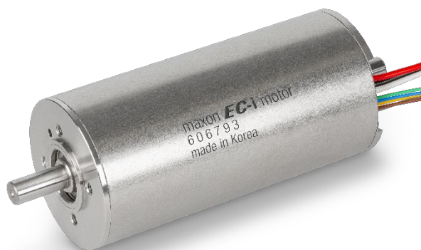
全新产品：EC-i 52 XL